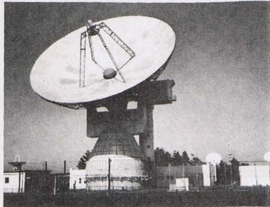
② VLBI実験に参加している郵政省電波研究所鹿島支所の直径26mのパラボラアンテナ。

くでそれぞれ正確な時間信号を記録する。時計には、1日に100億分の1秒程度しか狂わない水素メーザーなどの極めて精密な原子時計を使う。