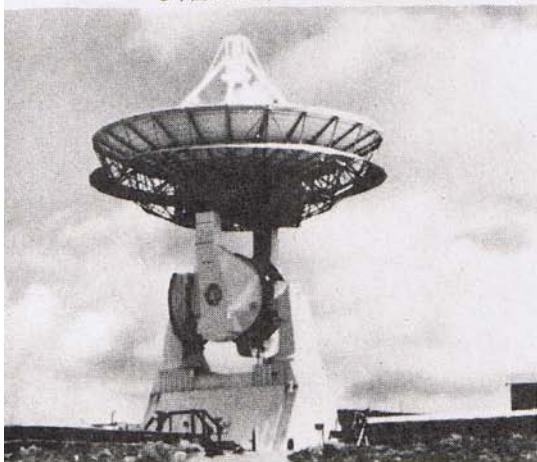
●米国カリフォルニア州モハービ局のアンテナ。